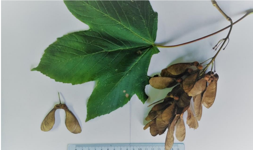
Figuur Esdoorn_esdoornblad en helikoptervleugeltje