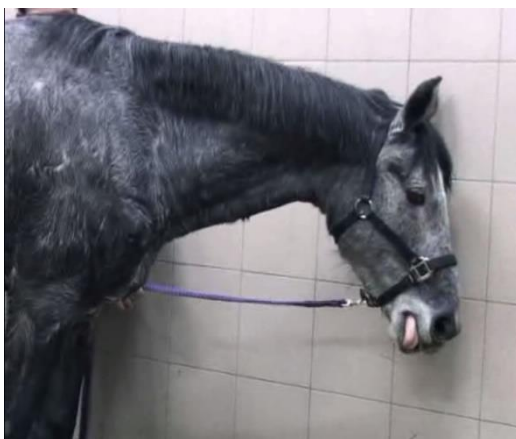
Foto: Lage kophouding en verminderd terugtrekken van de tong bij een paard met botulisme

Na deze periode van moeilijk eten en slikken worden progressief ook de spieren in de rest van het lichaam betrokken in het ziekteproces: de dieren bewegen steeds moeilijker en met korte passen, vertonen spierrillingen, kunnen het hoofd moeilijk omhoog houden en worden progressief zwakker tot ze in het slechtste geval uiteindelijk niet meer kunnen recht blijven. De uiteindelijke doodsoorzaak is in vele gevallen het uitvallen van de ademhalingspijpen waardoor de dieren stikken.