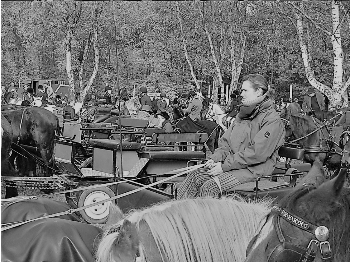
Antwoord : Paardenwijing Zandhoven 2004