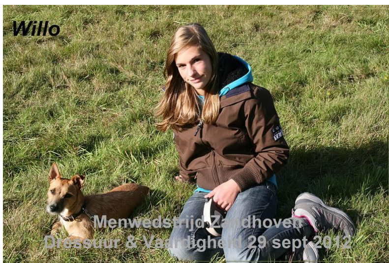
Sfeerbeeld van een wedstrijd onder een prachtige zon