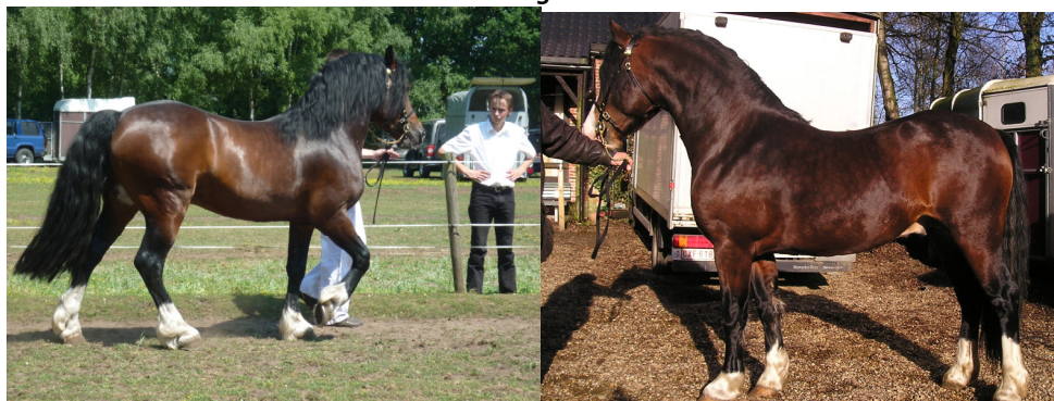
Tardebijge Easter Phoenix sectie D